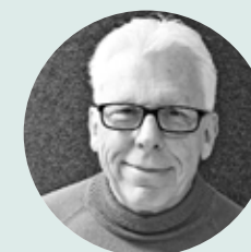
Genom läsbussen "Läster" och fokus på läsglädje och läsupplevelser, har vi tagit oss ut i landskapet och bidragit till att ge barnen likvärdiga möjligheter till kulturupplevelser. I vår nya biblioteksplan utgör

barnkonventionen ett av styrdokumenterna och plattformarna för verksamheten.