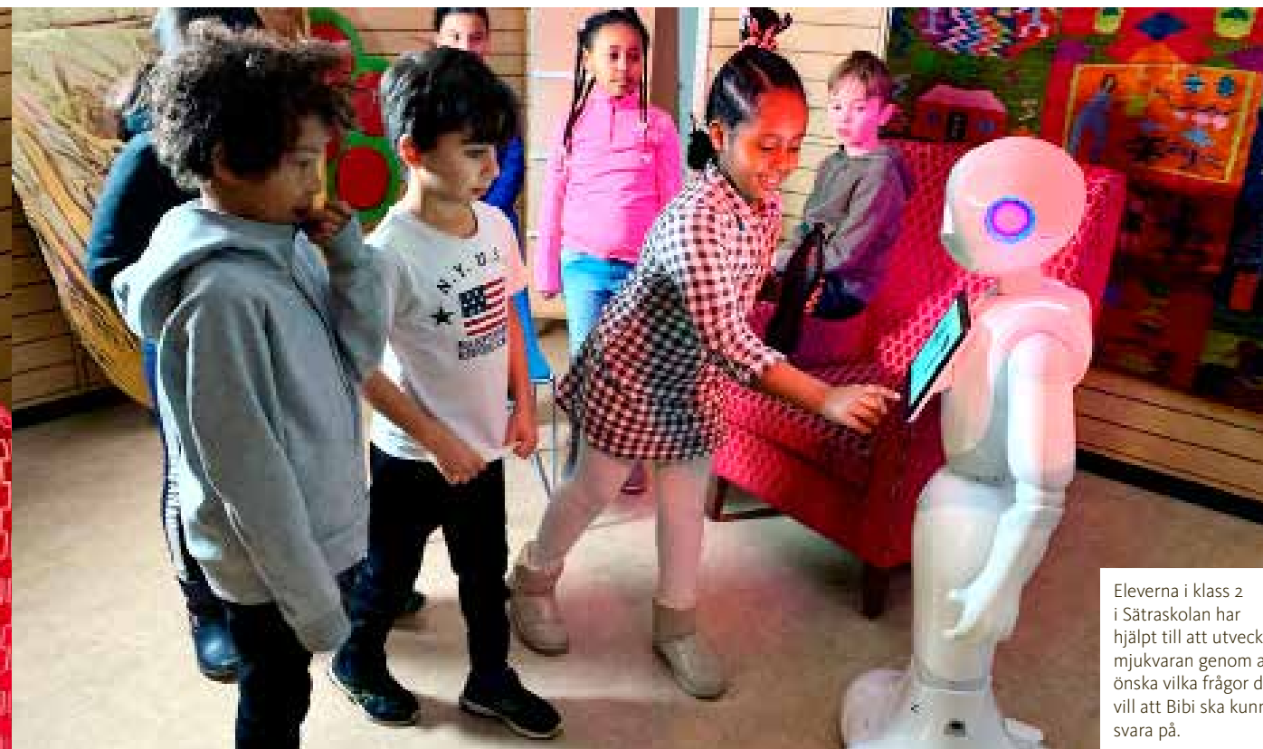
Eleverna i klass 2 i Sätterskolan har hjälpt till att utveckla mjukvaran genom att önska vilka frågor de vill att Bibi ska kunna svara på.