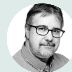
FOTO: PRIVAT En barnkulturfestival är planerad till nästa höst – men det är hur vi arbetar fram innehållet tillsammans med barnen som är målet. Det är ett sätt att träna på att använda barns perspektiv för ökad delaktighet.

Ledningsgruppen har gått en kurs som Kultur i Väst och SKL erbjuder, och alla biblioteksmedarbetare ska gå samma utbildning. Vi kommer även att arbeta utifrån modellen som beskrivs i Löpa linan ut .