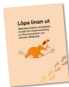
Skickades till alla chefer för folkbibliotek i våras.

”Man vill förbereda sig inför att konventionen blir lag, även om ingen vet exakt vad det kommer att innebära.”